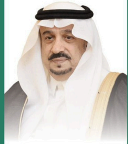
صاحب السمو الملكي الأمير فيصل بن بندر بن عبدالعزيز آل سعود أمير منطقة الرياض