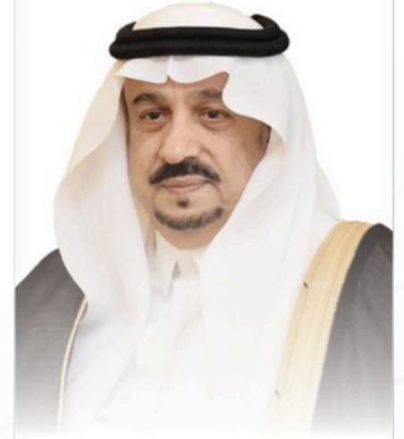
صاحب السمو الملكي الأمير فيصل بن بندر بن عبدالعزيز آل سعود أمير منطقة الرياض